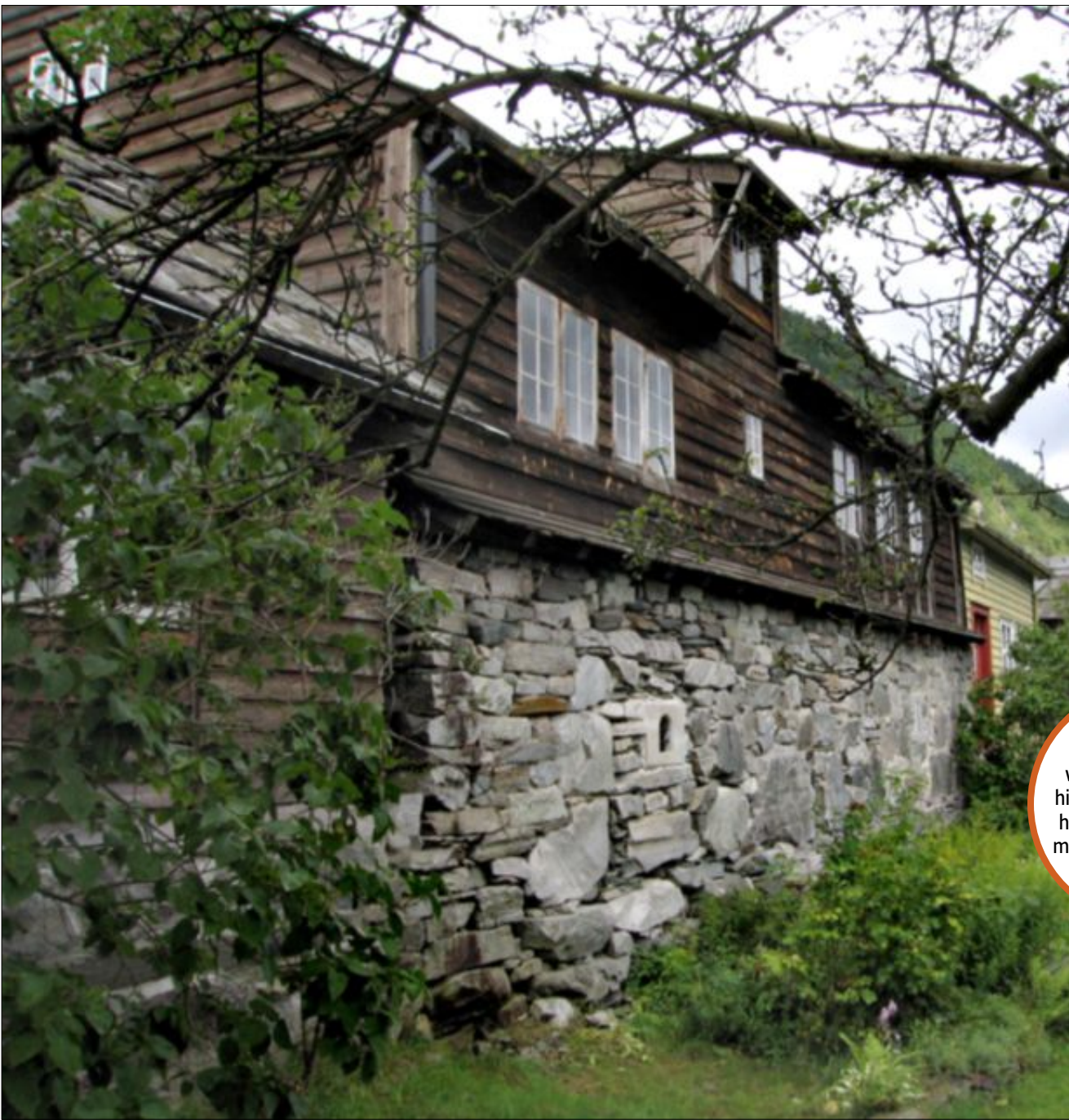
LAGMANSSTOVA: Musikken fra middelalderen er kommet hjem til Lagmannsstova på Agatunet.